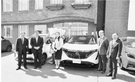
小笠原市長(写真左から2番目)と日産販売代表者ら

5月11日の締結式には、市側から小笠原市長(写真左から2番目)と日産販売代表者ら