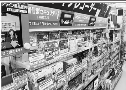
市販用でも通信型の品ぞろえが増えている

整備業のインテナーシップ札幌で説明会 6月から希望者を募集 国土交通省が高校生らを対象に全国で実施する自動車整備業のインテナーシップ事業の説明会が札幌市で開かれた。新車ディーラーや専門業者の経営者らが出席。全国で約300事業者から受け入れ希望が入っているという。 自動車整備士を目指す若者を増やす目的で国土交通省が初めて行う事業。整備事業所の仕事体験の受け入れ申し込みは3月3日に開始。北海道内でもすでに30事業所が受け入れ希望