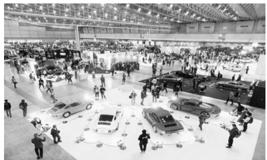
オートモビルカウンシル2023の会場