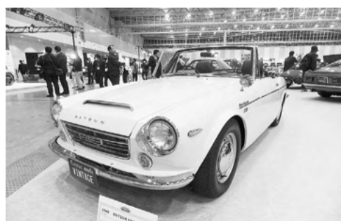
1969年製の日産「フェアレディ」