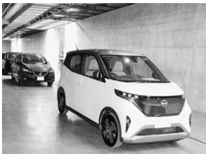
EVへの関心は徐々に高まっている

札幌市が、車両価格840万円以上の電気自動車(EV)への補助金支給率を2割減額した。EVの販売台数が増加する中、高額車への支給を減らすことで、より多くの購入者を補助できる狙いがある。