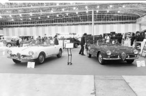
1960年代のアルファロメオのオープンカー