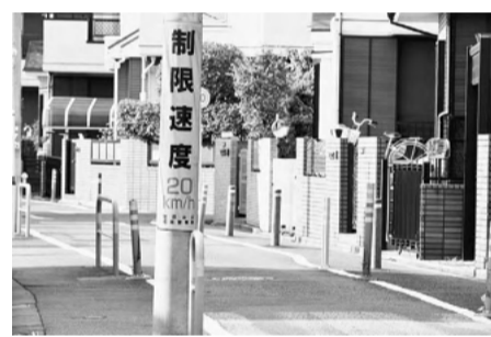
人優先の安全な生活道路空間を整備する